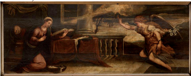
ANDREA SCHIAVONE, ANNUNCIAZIONE, CANTORIA, CHIESA DEI CARMINI,